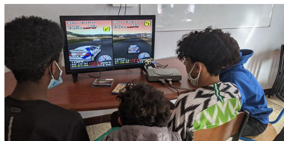
Le Projet Games Week