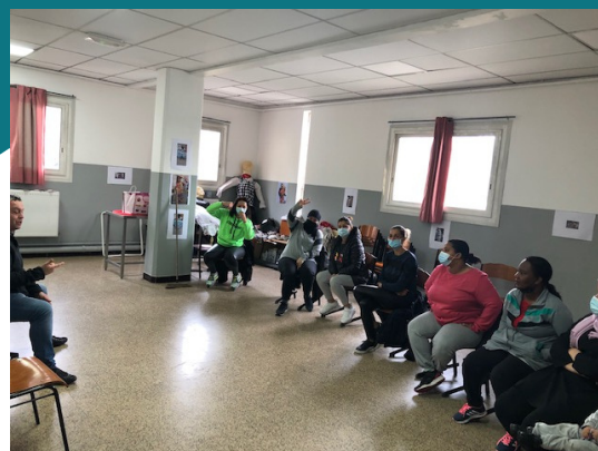
Les mamans du secteur "Familles"