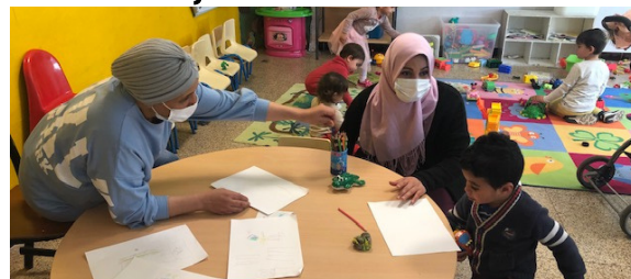
Temps de REAAP avec les mamans