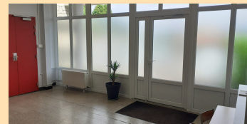
Photo de l'accueil rénové