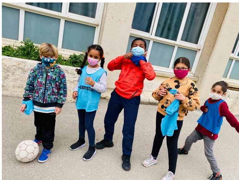
L'ACM en mode "Olympiades !"